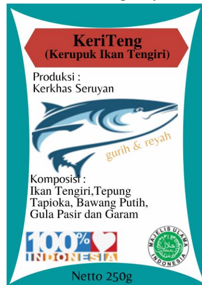
Gambar 3. Hasil Kemasan Kerupuk Ikan Tengiri

Budidaya Ikan agar nantinya dapat dimanfaatkan mahasiswa dan mahasiswi sebagai tambahan ilmu dan pengalaman, serta menjadi bekal bagi mahasiswa dan mahasiswi untuk berwirausaha kedepannya.