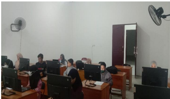
Gambar 1. Pemberian Materi

Kegiatan yang berlangsung dapat disimak dan dimengerti dengan baik oleh para peserta mahasiswa dan mahasiswi, ketertarikan para mahasiswa dan mahasiswi akan desain kemasan produk ini sangat antusias dan mereka dapat mengikutinya