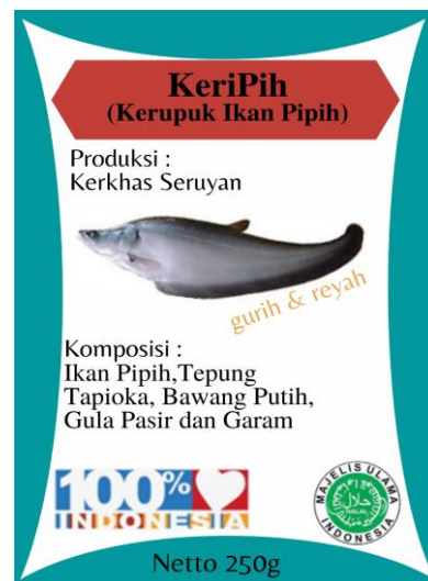
Gambar 4. Hasil Kemasan Kerupuk Ikan Pipih