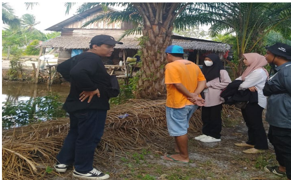
Gambar 1. Analisis Situasi Lingkungan