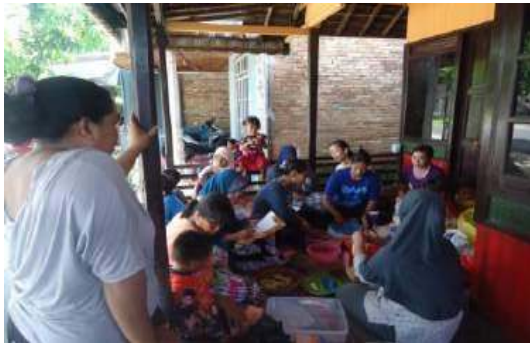
Gambar 3. Praktek Pengolahan otak-otak ikan

Pasca pemberian pelatihan pembuatan olahan ikan, ibu-ibu rumah tangga memiliki pengetahuan dan motivasi dalam pengolahan olahan ikan. Dimana survei terhadap peserta dilakukan sebelum dan sesudah kegiatan, survey dilakukan dengan menggunakan beberapa indicator capaian yaitu pemahaman mitra tentang olahan yang tepat dengan bahan baku yang tersedia, keterampilan atau cara pengolahan produk. Gambar 4 berikut: