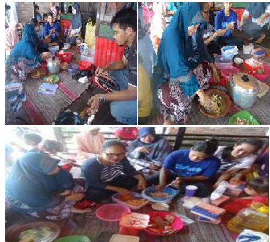
Gambar 2. Praktek Pengolahan Dimsum Somay

Selanjutnya instruktur dari tim pelaksana menyampaikan hal-hal yang berkaitan dengan kegiatan yang dilaksanakan, peserta terlihat antusias mengikuti kegiatan ini dan mereka sangat tertarik untuk mencoba, selanjutnya tim pelaksana membagi tugas para ibu-ibu rumah tangga di RT.032, ada yang bertugas menimbang bahan, ada yang mengupas bawang, ada yang mengulek bumbu, ada yang mengupas wortel dan diserut, ada yang mengadon bahan, dan ada juga yang menyiapkan penggorengan. Kemudian setelah adonan sudah dicampur bumbu para ibu-ibu mulai membungkus dimsun yang diolah dengan kulit pangsit dan diberi hiasan wortel setelah itu dikukus dan setelah selesai dikukus kemudian dilakukan penggorengan.